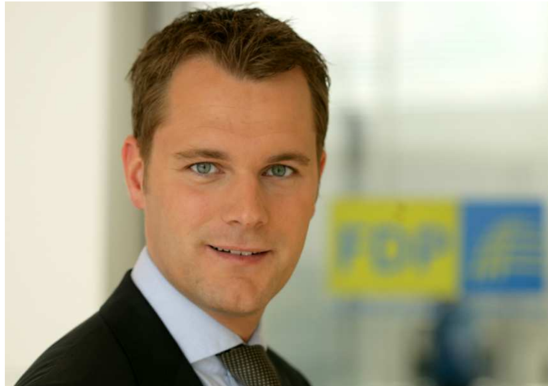
Daniel Bahr - Parlamentarischer Staatssekretär im Gesundheitsministerium